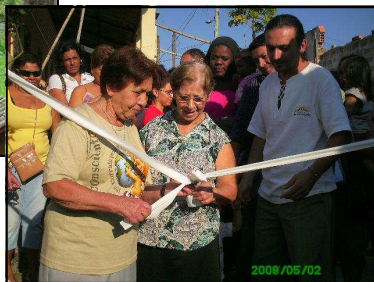
Ato de Posse dá área pela AMOVITA depois da doação das famílias, 2/5/09.