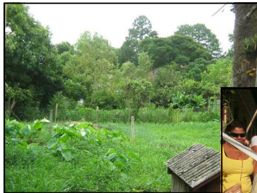
Área da Creche: muito verde será preservado.

Em reunião com a SEHADUR, em junho, a coordenação da AMOVITA entregou toda a documentação necessária para concretização da cedência do terreno à SMED.